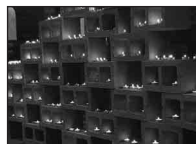
Adventsactie Welzijnszorg: kleine lichtjes geven hoop

De plaatselijke werkgroep Welzijnszorg - Broederlijk Delen neemt jaarlijks enkele initiatieven om de parochianen te informeren, te engageren en geld in te zamelen voor projecten van de regionale organisatie.